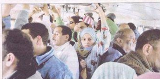
Fotograma de la pel·lícula 'Pink saris'.

Amb el títol Una mirada universal al fenomen de la violència contra les dones , aquest divendres s'enceta, al Centre d'Art Lo Pati, una nova edició del cicle Cinema al Pati, que comptarà amb la projecció de tres films que aportaran un punt de vista universal, cinematogràfic i amb segell d'autor al fenomen de la violència contra les dones. El cicle s'encetarà a la tarda amb la projecció de la pel·lícula indo-anglesa de Kim Longinotto Pink saris ( La revolució dels saris rosa ). La pel·lícula és un dur però, alhora, divertit documental sobre la cruel situació que viuen les noies i dones a l'Índia, obligades a casar-se per força. Després de la projecció del documental es farà un fòrum obert a càrrec d'Assumpta Eixarch, antropòloga social experta en temes d'immigració. Dissabte, a les 18.00 hores, es pro-